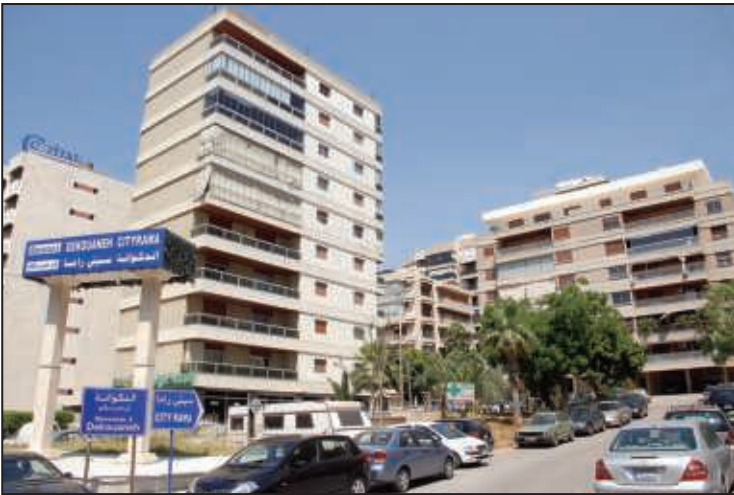
مدخل سيتي رامنا وحي الكهرباء من بولفار الرئيس فؤاد شهاب