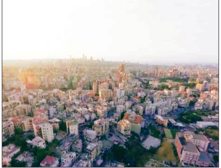
مناطق الدكوانة الضيعة (الوسط) وراس الدكوانة (إلى اليسار)