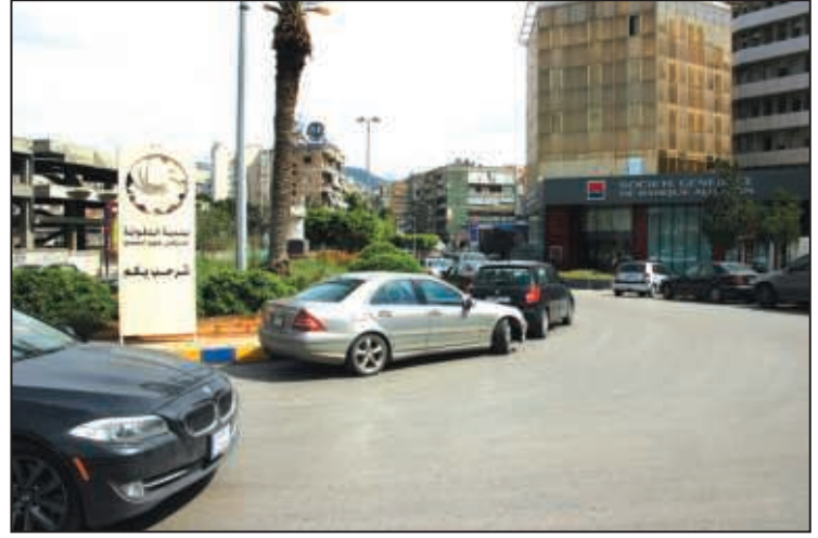
مدخل بولفار إميل إده / مستديرة الصالومي / شارع الباش مارون خوري