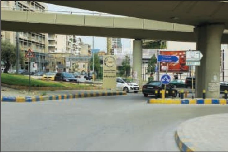
مدخل بولفار الرئيس فؤاد شهاب / مستديرة الحايك / بولفار أنطوان شختورة