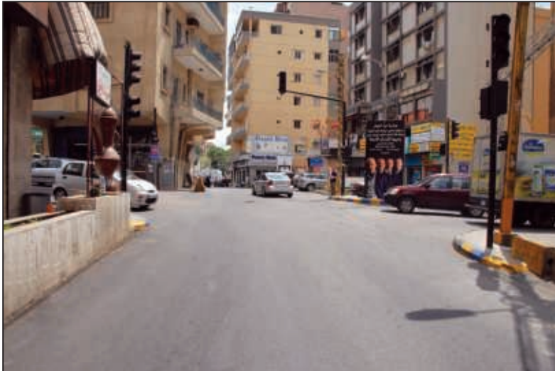
تقاطع الشامي بين شارع إميل قيصر أبو حبيب وحي السلاف