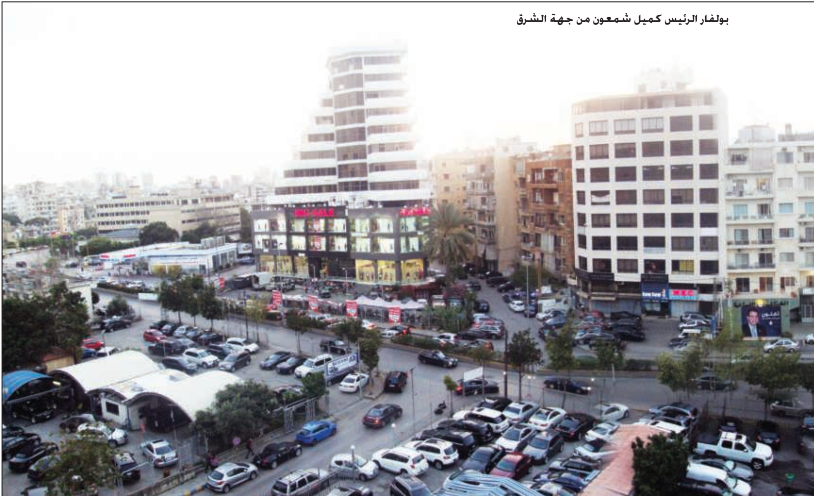
بولفار الرئيس كميل شمعون من جهة الشرق