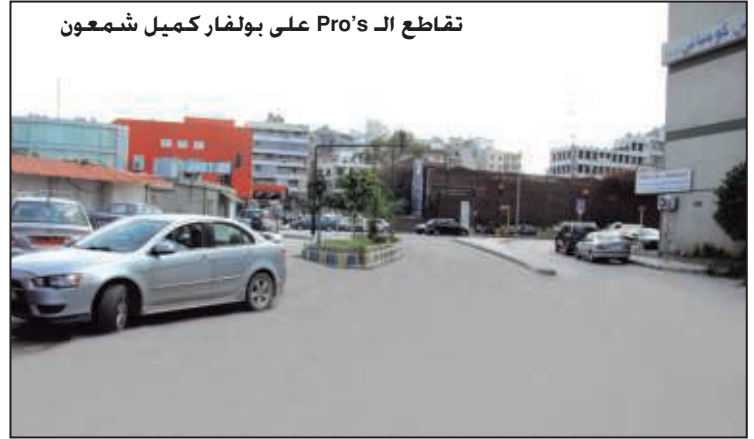
تقاطع الـ Pro's على بولفار كميل شمعون