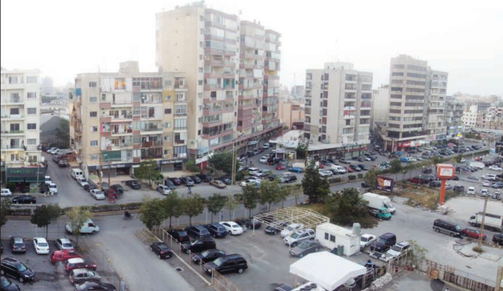
بولفار الرئيس كميل شمعون من جهة الشرق