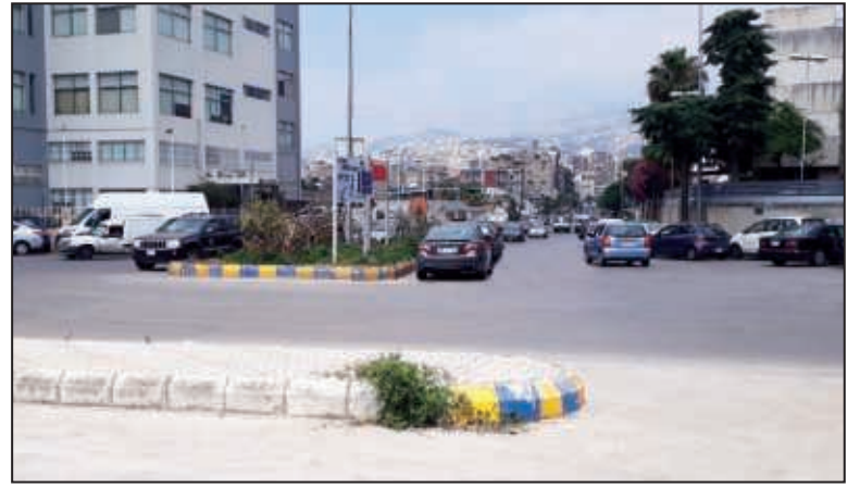
تقاطع الميدان بين شارعي أنطون بطرس بو عبود وعبد الرحيم دياب