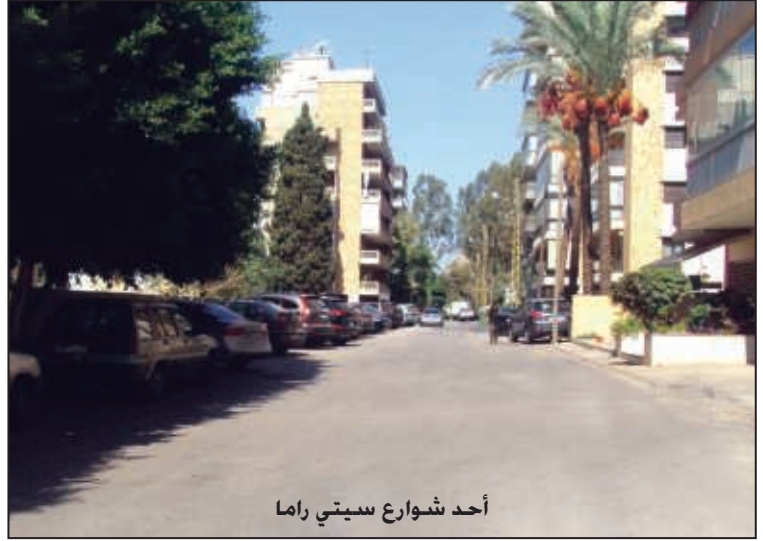
أحد شوارع سيدي راما