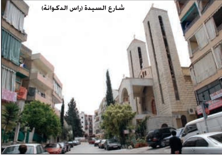
شارع السيدة (راس الدكوانة)