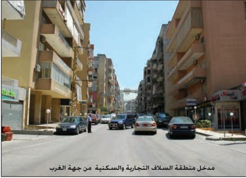
مدخل منطقة السلاف التجارية والسكنية من جهة الغرب