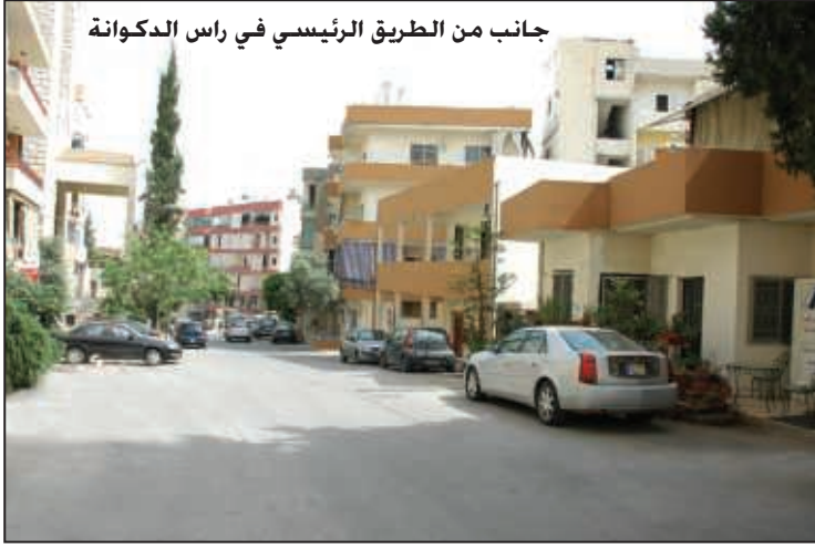
جانب من الطريق الرئيسي في راس الدكوانة