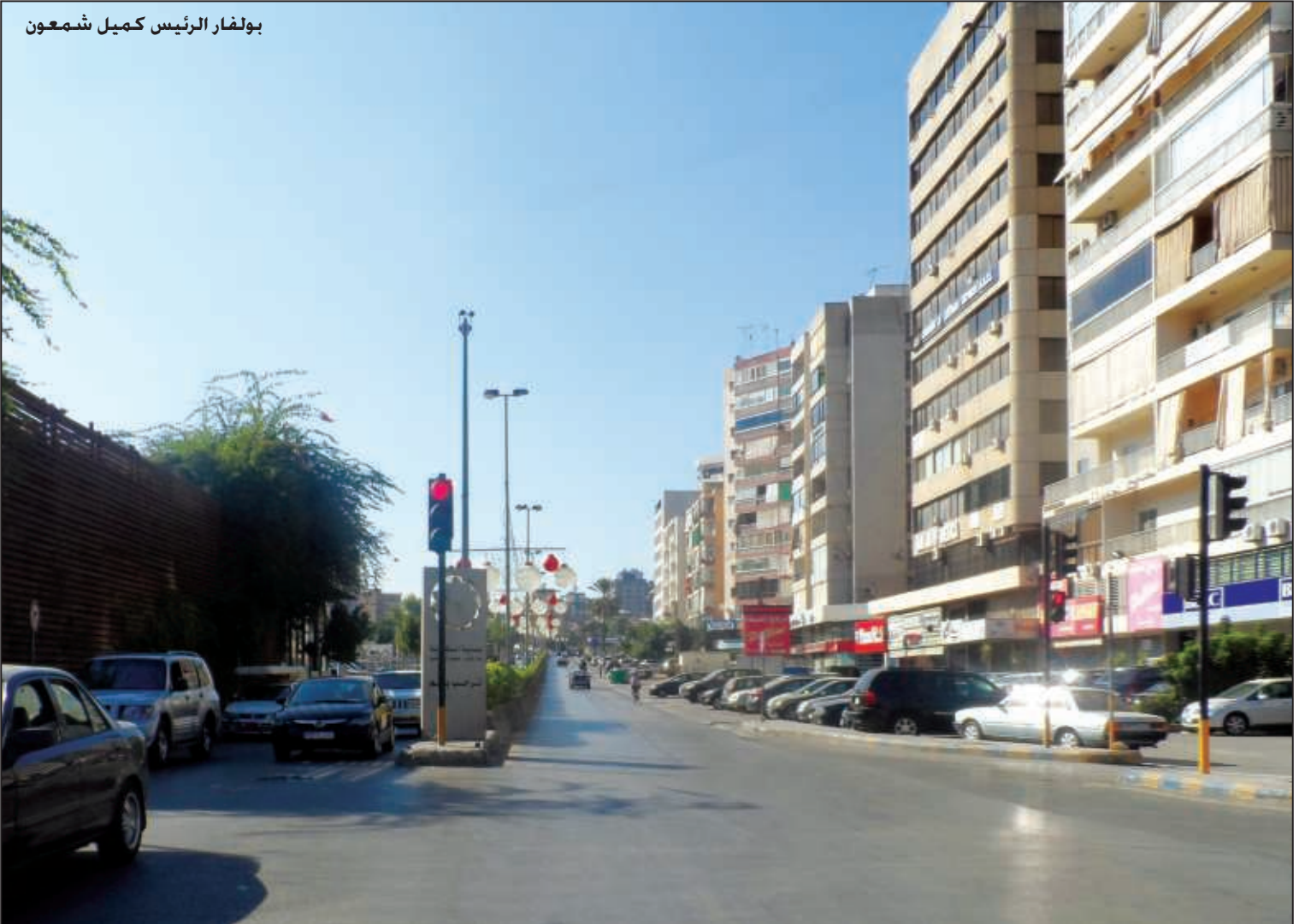
بولفار الرئيس كميل شمعون