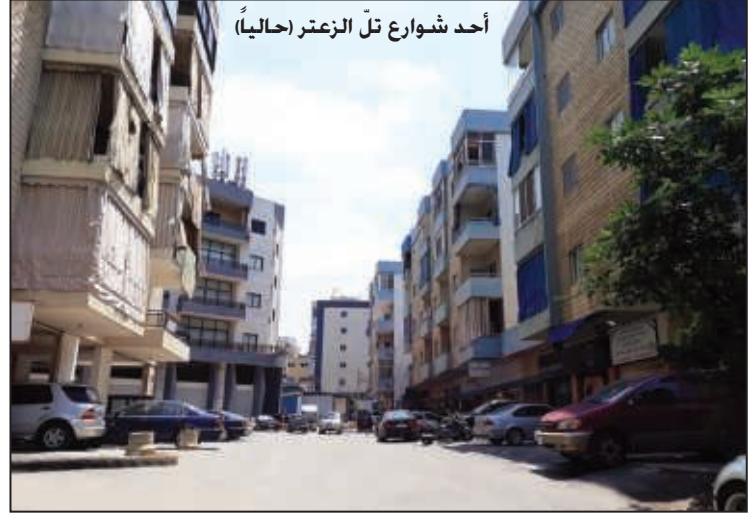
أحد شوارع تلّ الزعتر (حالياً)