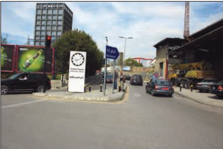
مدخل مستديرة المكسّ / الدكاونة شارع جورج متى (تلّ الزعتر)