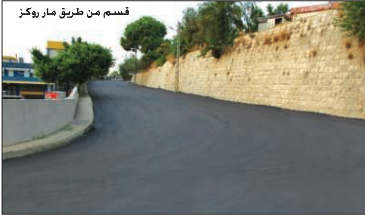
قسم من طريق مار روكس