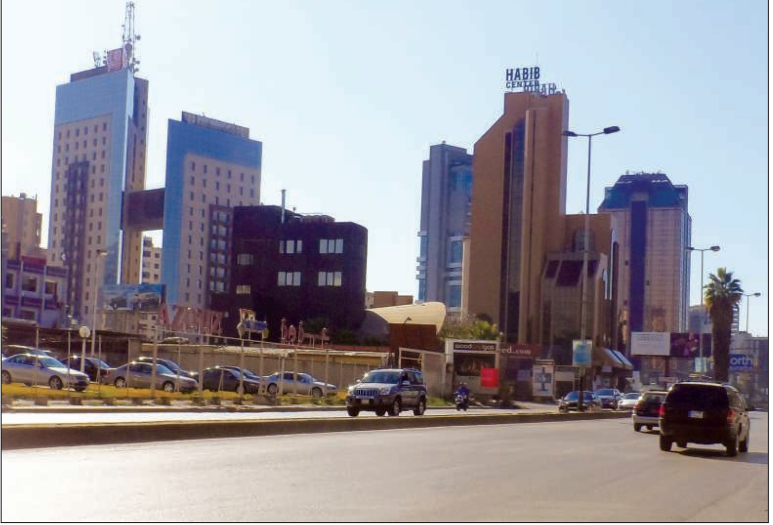
جانب آخر من منطقة B-District بولفار أنطوان شختورة