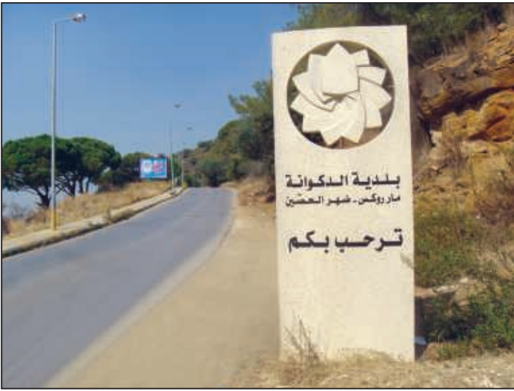
مدخل مار روكز من المنصورية / عيلوت