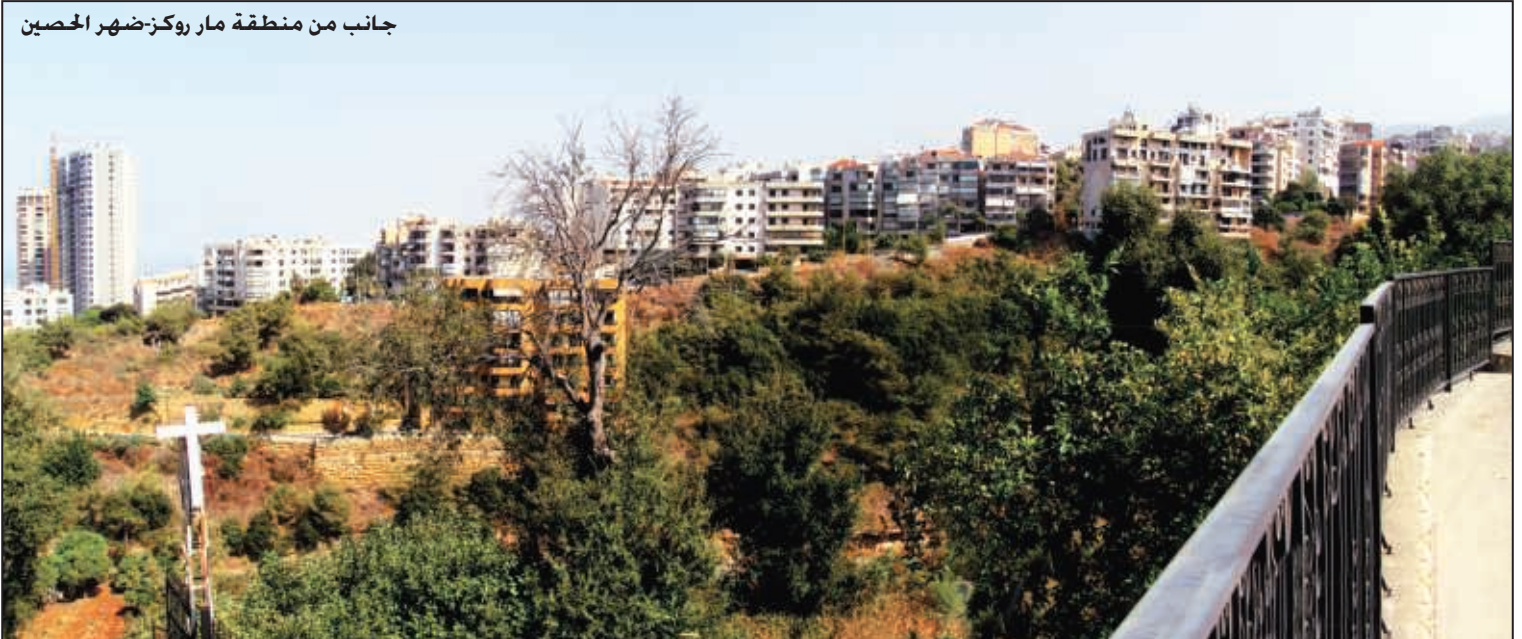
جانب من منطقة مار روكز-ضهر الحصين