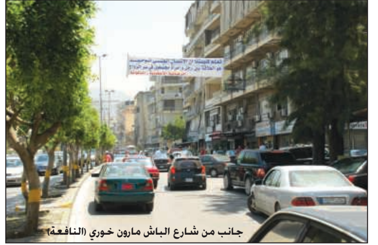
جانب من شارع الباش مارون خوري (النافعة)