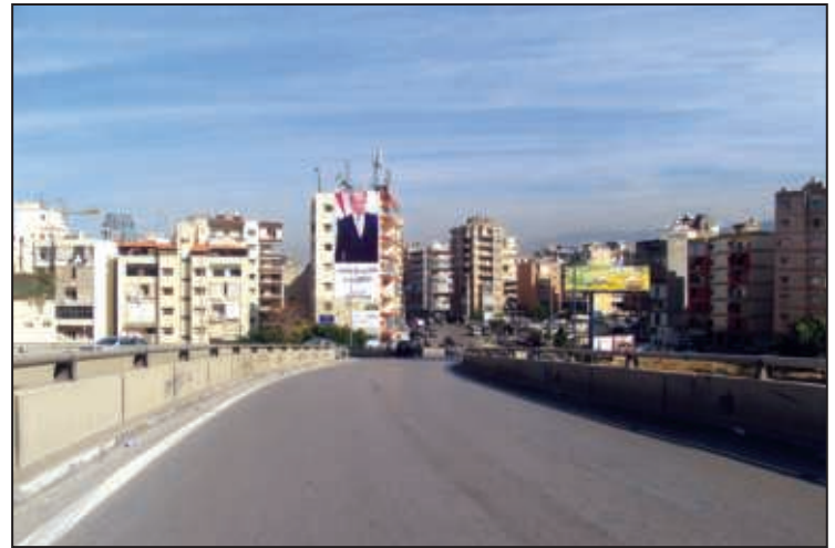
مدخل مستديرة المتروبوليتان / جسر الحايك / بولفار أنطوان شختورة