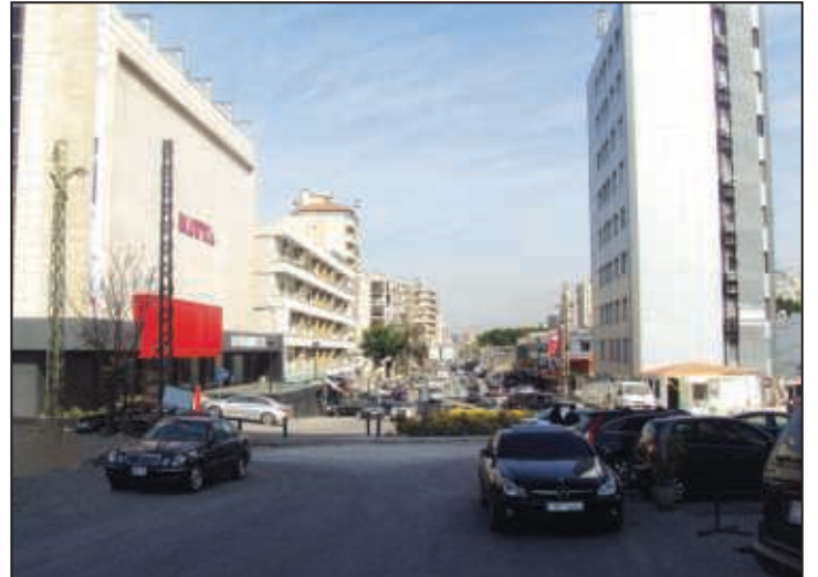
تقاطع جادة وديع الصافي/كالبيري متي