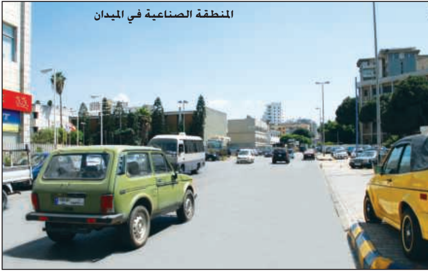
المنطقة الصناعية في الميدان