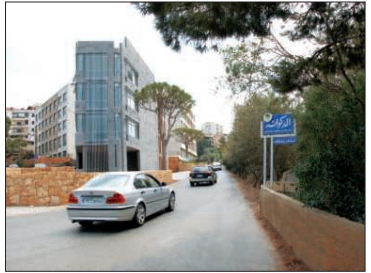
مدخل مار روكز من عين سعادة رقم ٢

مستديرة الصالومي تستقبلكم وتودّعكم في الدكوانة برفرة العلم اللبناني شامخاً