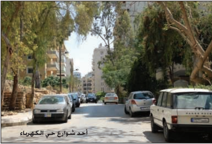
أحد شوارع حي الكهرياء