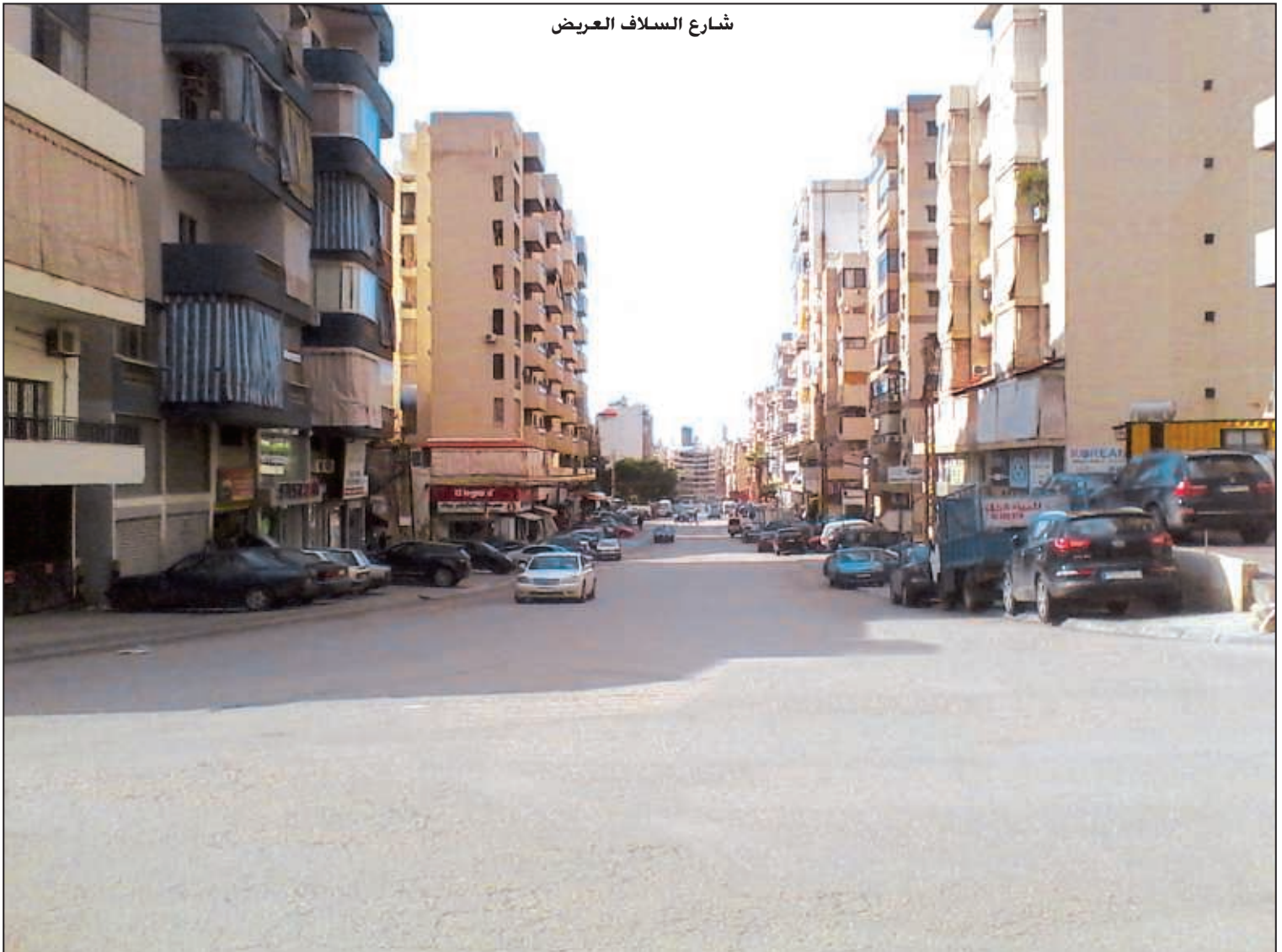
شارع السلاف العريض