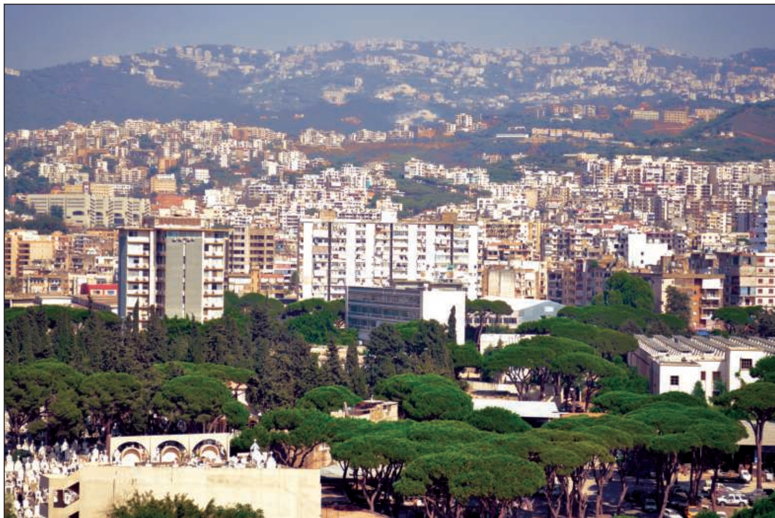
منطقة الميدان وتبدو في أعالي الصورة مناطق الفنار وعين سعادة وبيت مري