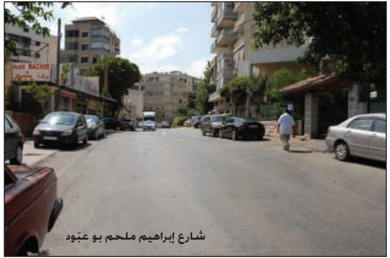
شارع إبراهيم ملحم بو عبود