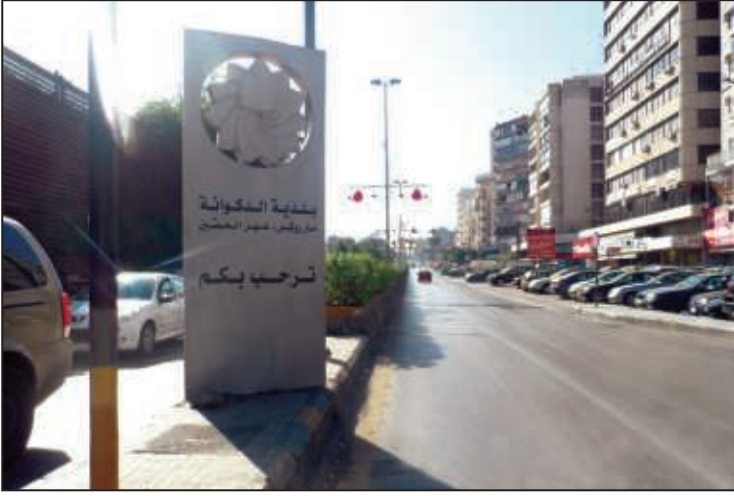
مدخل سدّ البوشيرية / بولفار الرئيس كميل شمعون