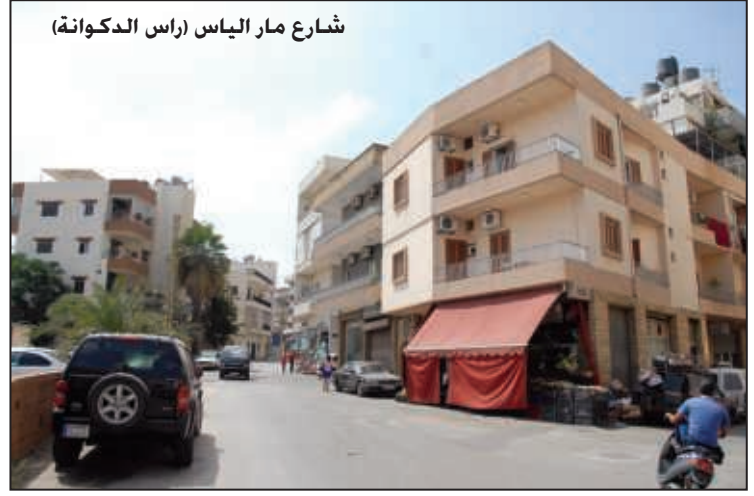
شارع مار الياس (راس الدكوانة)