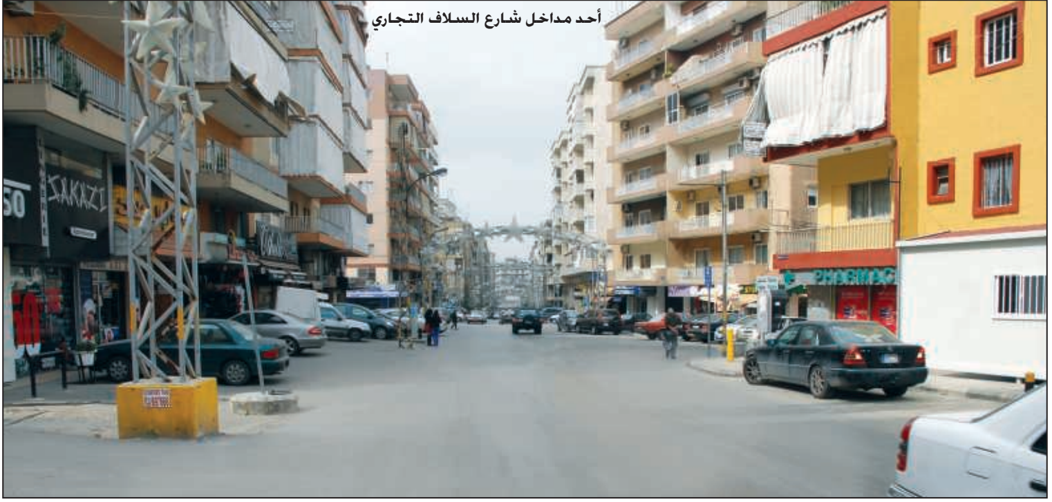
أحد مداخل شارع السلاف التجاري