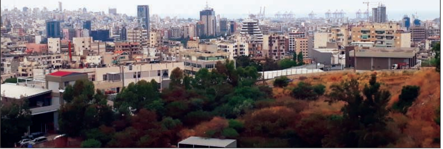
جانب من المنطقة السكنية في مار روكز والى اليمين أحد مباني الجامعة اليسوعية