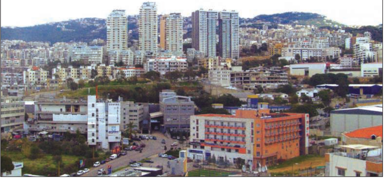
منطقة مار روكز-ضهر الحصين