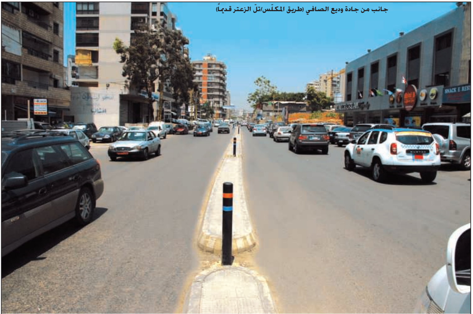
جانب من جادة وديع الصافي (طريق المكس/تل الزعتر قديماً)