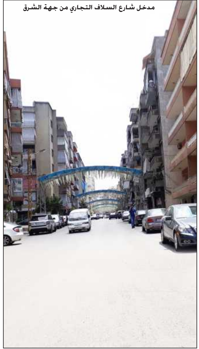
مدخل شارع السلاف التجاري من جهة الشرق