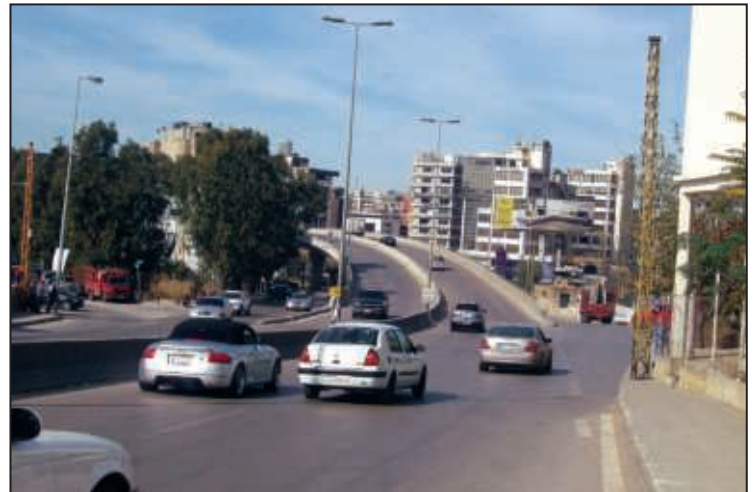
مدخل المنصورية / مستديرة المكسّ / الدكاونة