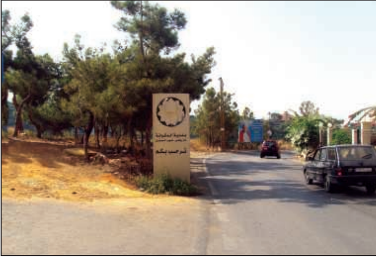
مدخل مار روكز من عين سعادة رقم ١