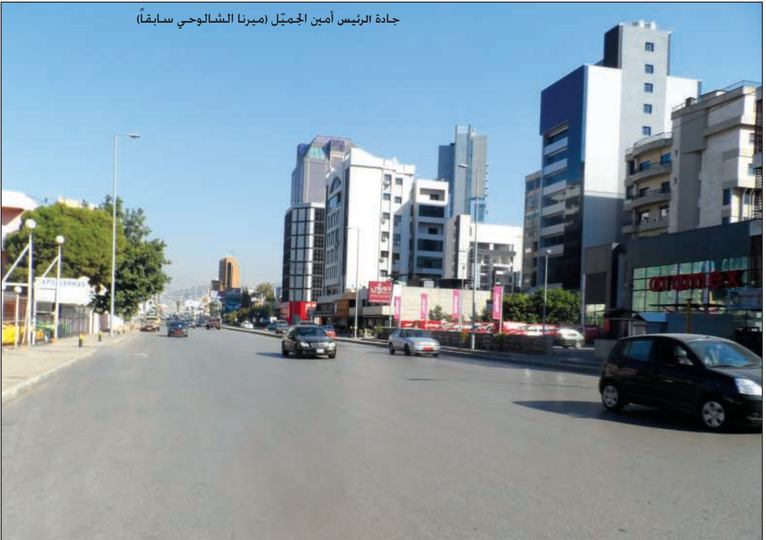
جادة الرئيس أمين الجميل (ميرنا الشمالوحي سابقاً)