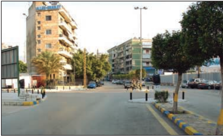
تقاطع سكرية بين بولفار أنطوان شختورة وشارع الباش مارون خوري