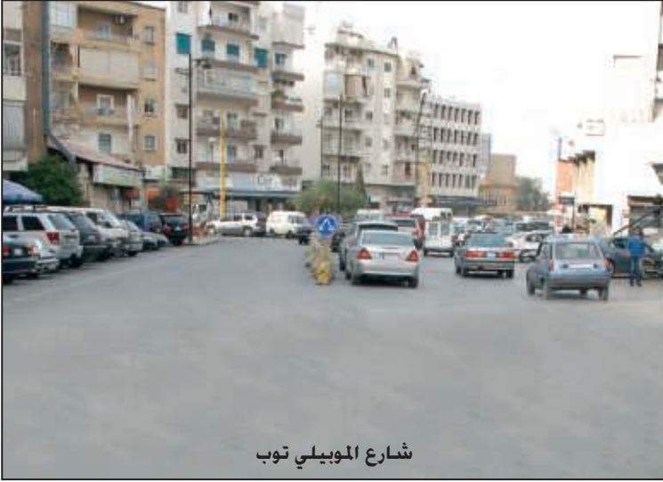
شارع الموبيلي توب