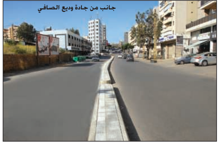
جانب من جادة وديع الصافي