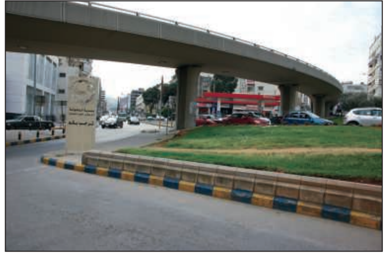
مدخل بولفار الرئيس إميل إده / مستديرة الحايك / بولفار أنطوان شختورة