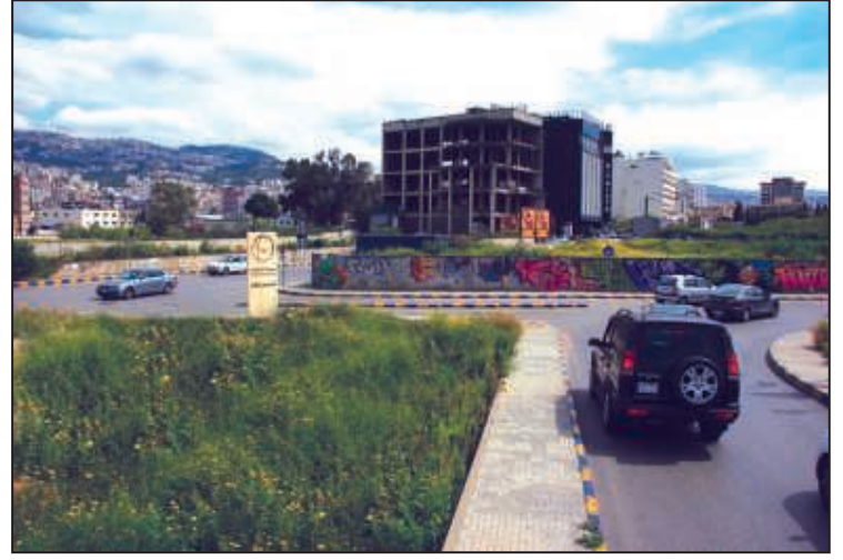
مدخل منطقة الميدان عبر جادة الإستقلال من الأشرفية